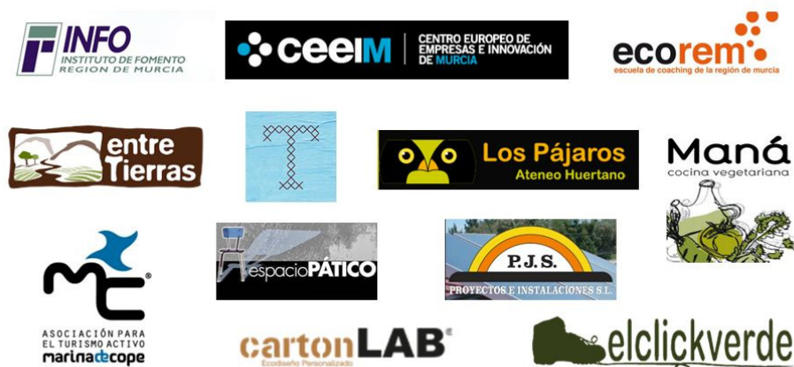
FIG. 4. Entidades colaboradoras durante el desarrollo del curso de formación ECO Startup.