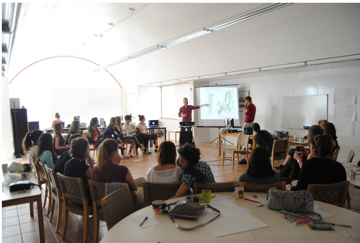
FIG. 3 Presentaciones de los diversos países.

Consideramos que dicha actividad fue muy valiosa y aportó mucho a la calidad del curso, ya que los participantes conocieron la situación de los demás y terminaron sabiendo donde se sitúa su propio país cuando se trata de desempleo y emprendimiento. Los participantes destacaron como las conclusiones más sorprendentes de la actividad las diferencias en el proceso de creación de una empresa y la financiación necesaria para hacerlo. Se destacó como algo común la mentalidad como obstáculo al emprendimiento - casi en todas las presentaciones se mencionó “la mentalidad”, especialmente la visión de la sociedad del “trabajo seguro”, es decir, por cuenta ajena o asalariadas como la situación ideal y el “miedo al fracaso” como uno de los obstáculos más grandes para emprender.