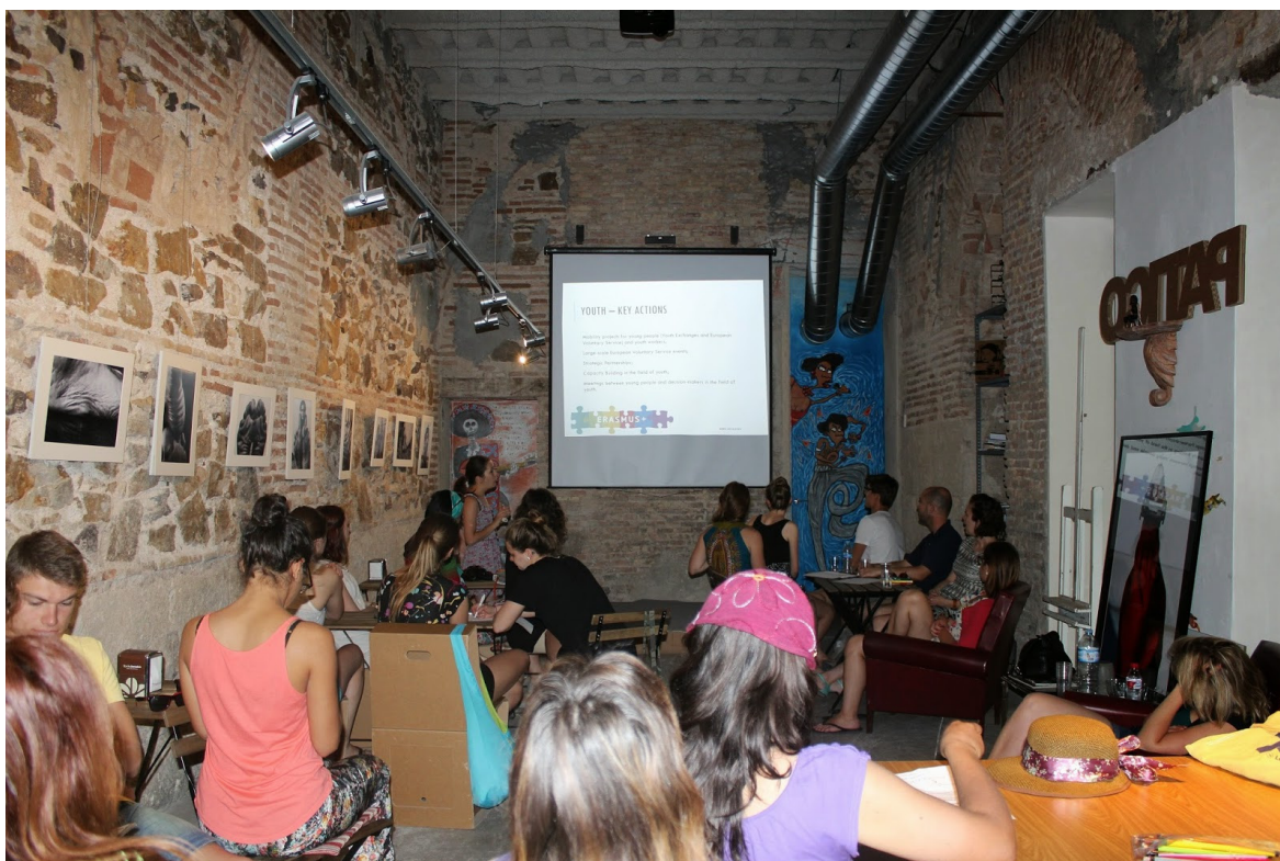
FIG. 5 Taller en Espacio Pático.