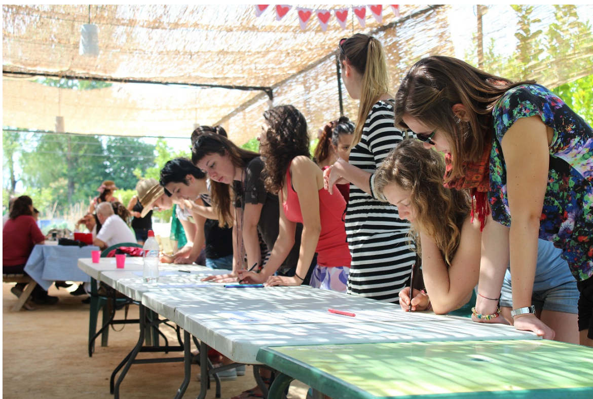
FIG. 4 Taller en Los Pájaros - Ateneo Huertano.